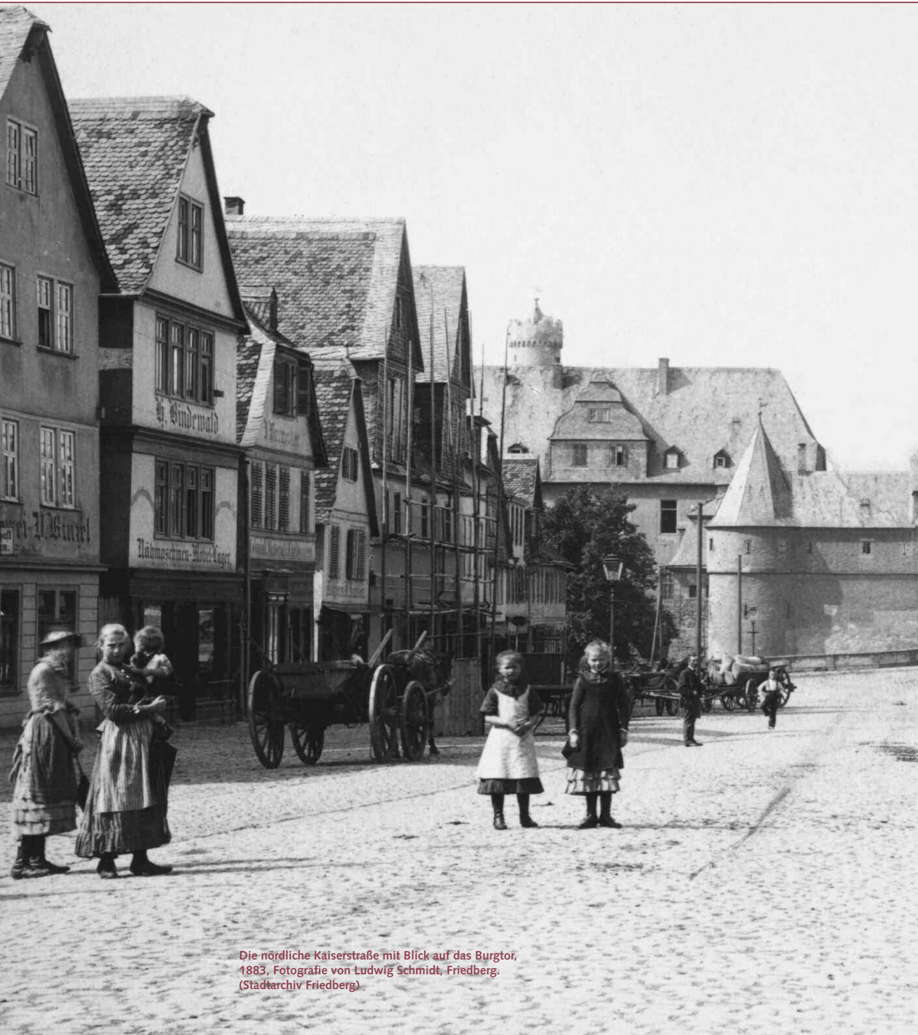
Die nördliche Kaiserstraße mit Blick auf das Burgtor, 1883, Fotografie von Ludwig Schmidt, Friedberg. (Stadtarchiv Friedberg)

Die Kaiserstraße ist heute, wie schon zur Zeit der großen Friedberger Messen im 13. Jahrhundert, die zentrale Straße und damit die herausragende Lebensader Friedbergs. Die einstige „Breite Straße“ war von Anfang an anstelle eines Marktplatzes als Marktstraße konzipiert. Mit einer Breite von bis zu 45 Metern besitzt sie als Ganzes die Qualität eines großen Platzes, wie es bei großen Events, wie zum Beispiel „Friedberg frühstück“ oder „Friedberg spielt“, besonders deutlich wird. Die Bausubstanz der Häuser, die bis in das Mittelalter zurückreicht und Häuser aus allen Jahrhunderten bis heute umfasst, ist in Teilen von hoher Qualität und bildet eine denkmalgeschützte Gesamtanlage. Während in Frankfurt die „neue Altstadt“ in jüngster Zeit – nach der Zerstörung im Zweiten Weltkrieg – neu errichtet und sofort zur Touristenattraktion wurde, hat Friedberg noch eine gewachsene Altstadt und eine Straße, in der 800 Jahre Geschichte unmittelbar zu erleben sind. Die Friedberger Bürgerinnen und Bürger können stolz auf diese Straße sein, deren Potential heute freilich noch nicht ausgeschöpft ist.