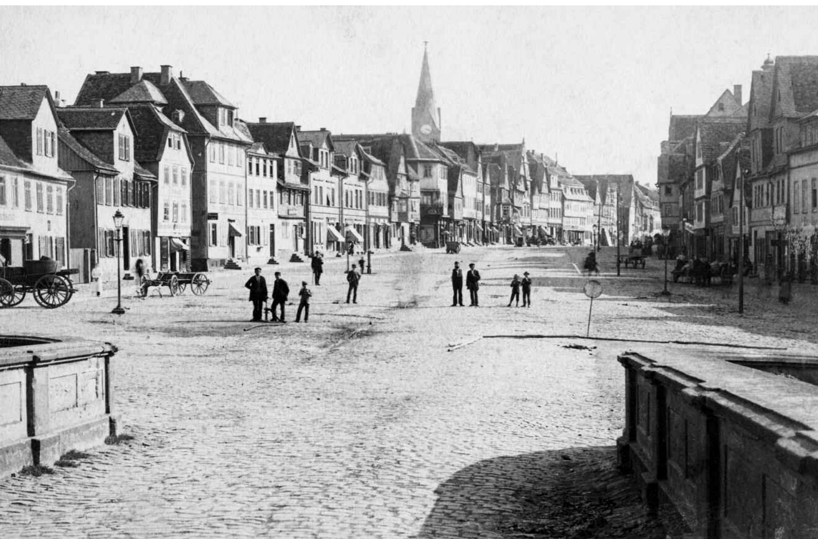
Blick vom Burgtor auf die Kaiserstraße, 1894, Fotografie von C. Hertel, Mainz. (Stadtarchiv Friedberg)

Kleine Abbildung: Aufnahme 2012 vom gleichen Standort aus. (Foto: Johannes Kögler)