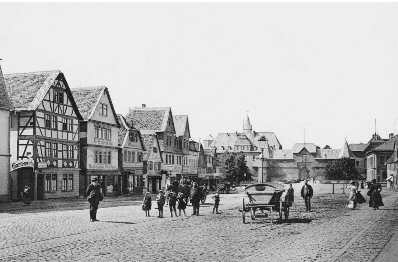
Die nördliche Kaiserstraße mit Blick auf das Burgtor, 1899, Verlag v. Römmeler & Jonas, Dresden.

Kleine Abbildung: Aufnahme 2012 vom gleichen Standort aus.